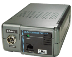
XS-40D / XS-40D FA