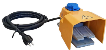
Poljin kiinteisiin asennuksiin