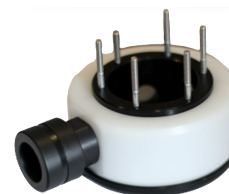
Saatavana myös hyvinvarustettu XARGS-setti muovisalkussa.