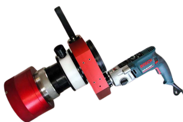
Offset-vaihteisto pitkille vaarnoilte