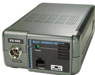
XS-40D / XS-40D FA