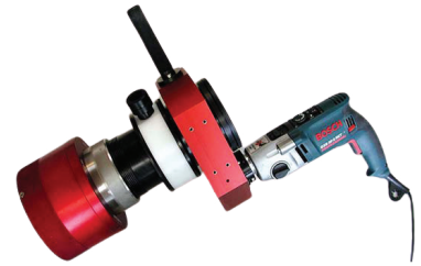
Offset-vaihteisto pitkille vaarnoille