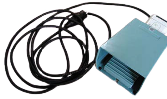
Poljin kiinteisiin asennuksiin