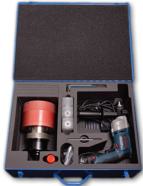
Saatavana myös hyvinvarusteltu XARGS-setti metallisalkussa